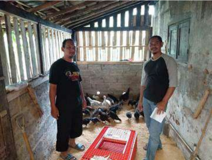
Pembinaan ke peternak mitra