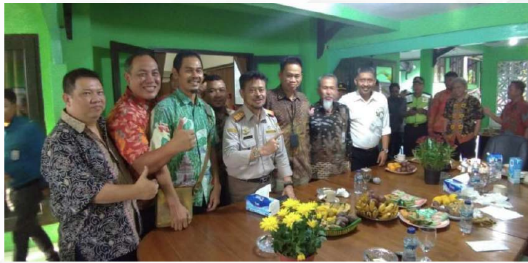
Kunjungan Menteri Pertanian