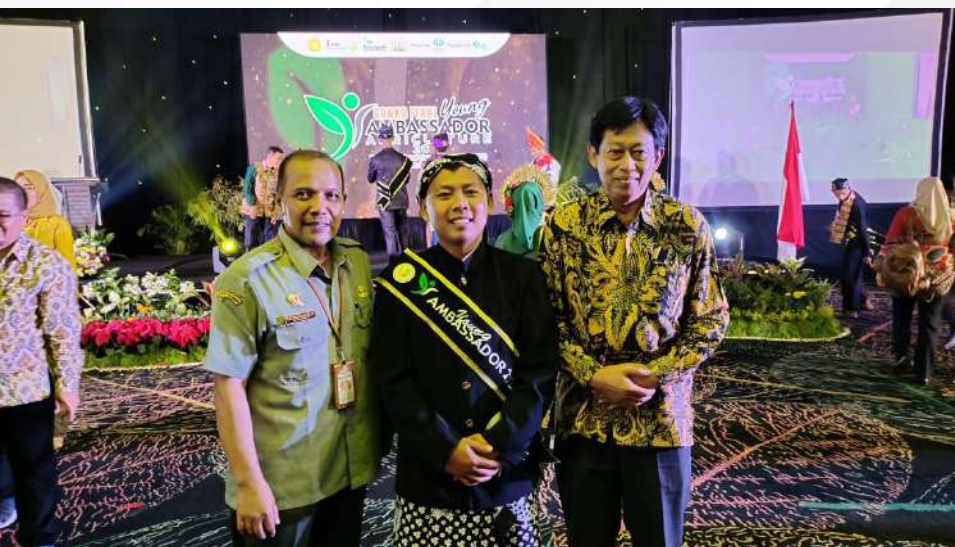
Penghargaan Young Ambassador Kementerian Pertanian