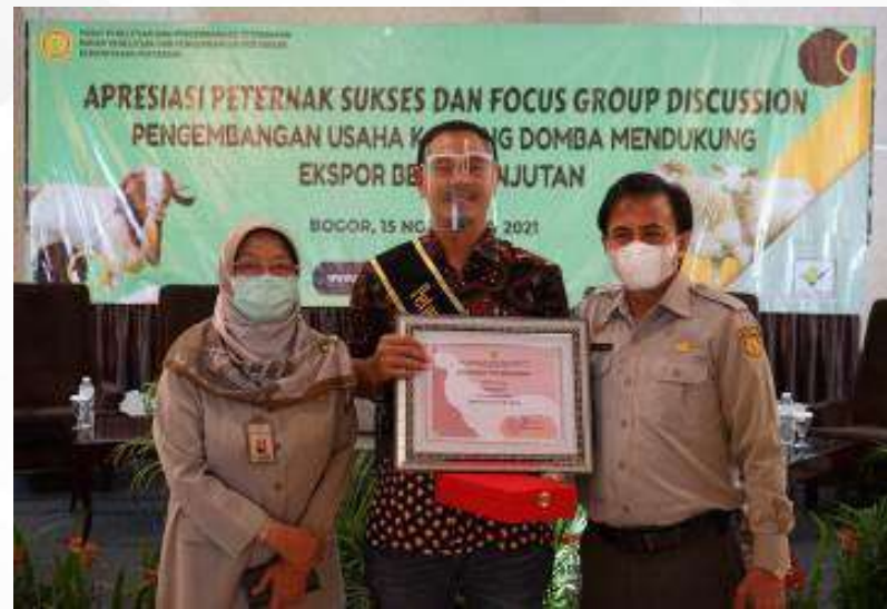
Penghargaan Peternak Sukses dari Kementerian Pertanian