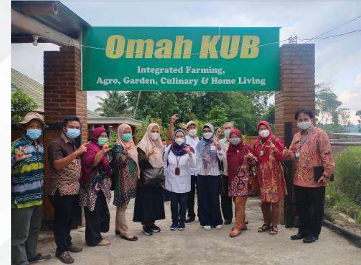
Kunjungan BSIP se Indonesia